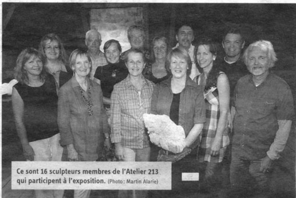
Ce sont 16 sculpteurs membres de l'Atelier 213 qui participent à l'exposition.

Lemire, responsable de l'exposition à l'Atelier 213.